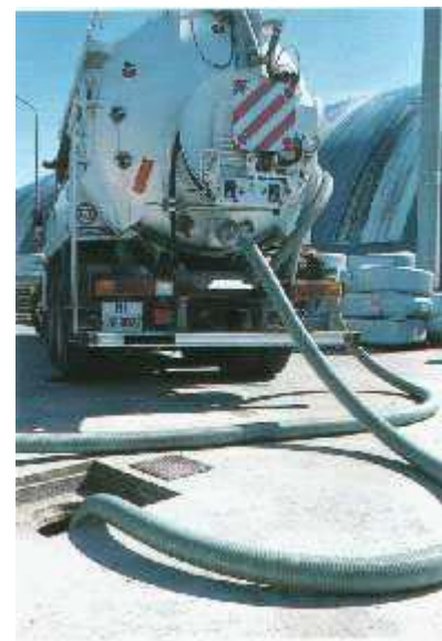
Grüner-PVC-Scheuerschutz Hoch-flexibles Weich-PVC