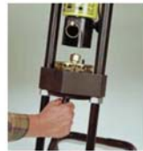
4. Vormontierten Schlauch von unten in den Preßbackensatz schieben und die Armatur auf den Backenschlag aufsetzen.