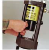
2. Arretierung lösen und Preßstempel nach hinten schwenken.