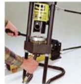
6. Preßstempel in Preßstellung arretieren. Durch Pumpen Druck aufbauen bis der Backenring voll auf der Grundplatte aufliegt.