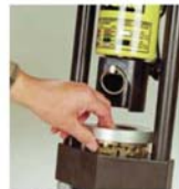
5. Backenring entsprechend der Schlauchtype auf die Backensegmente auflegen.