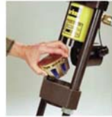
3. Backensatz einlegen und auf gleichmäßige Verteilung der Backensegmente achten.