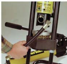
7. Druck entlasten (Flügelmutter am Pumpenausgang) und fertige Schlauchleitung entnehmen.