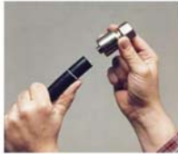
1. Länge der Fassung am Schlauchende markieren, Armatur auf den No-Skive Schlauch bis zur Markierung aufschieben.